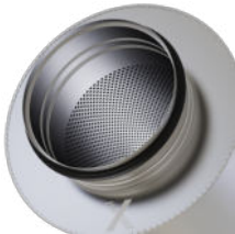
Rohrstutzen mit Lippendichtung